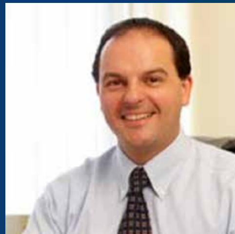
Carlo Scollo Lavizzari.

* Para consultar el documento completo: www.internationalpublishers.org/images/Accessibility/IPA_Guide_to_the_Marrakesh_Treaty.pdf