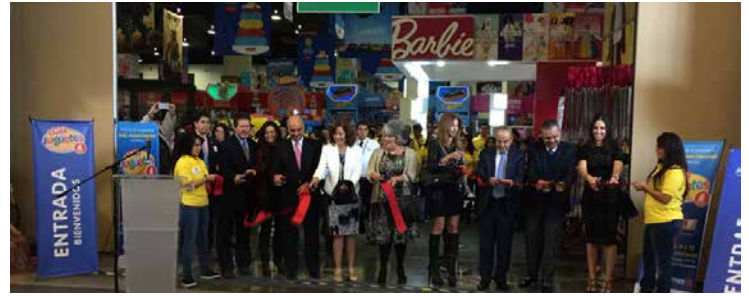
Inauguración de Expo Tus Juguetes.

Junto a una gran oferta de 500 mil juguetes y material didáctico, se estima que los visitantes diarios fueron 250 mil y encontraron, además, un amplio catálogo de títulos de editoriales como Selector, 3 Abejas, Advanced Marketing, Amaquemecan, Cidcli, Ediciones El Naranja y Libros para Imaginar.