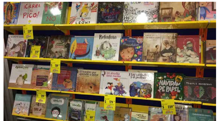
Participaron editoriales con oferta para niños y jóvenes.

La entrada fue gratuita y adicionalmente se llevaron a cabo actividades como conferencias, talleres, cuentacuentos, presentaciones de libros, recitales, rifas, regalos de libros e incluso un grupo de artistas gráficos pintaron murales de piñatas con la colaboración del público.